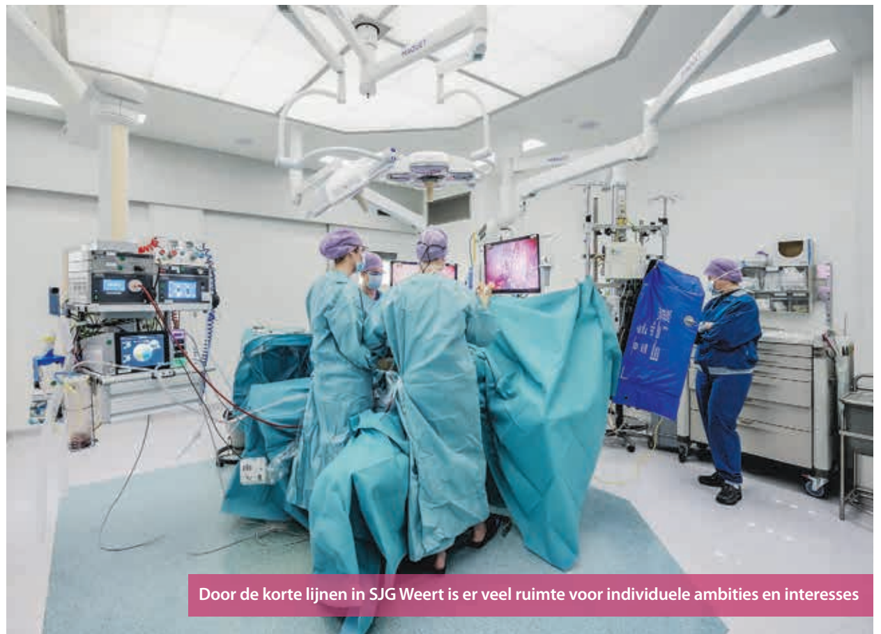
Door de korte lijnen in SJG Weert is er veel ruimte voor individuele ambities en interesses

Op de OK is geen dag hetzelfde. Elke patiënt is anders, elke operatie vraagt om de opperste concentratie van het team. Specialisten, OK- en anesthesieassistenten, recoverymedewerkers en ondersteunende medewerkers: in het operatiecentrum werkt een diversiteit aan collega's samen. "Dat maakt het werk zo mooi. Ieder werkt vanuit zijn eigen taak en verantwoordelijkheid. Samen zijn we